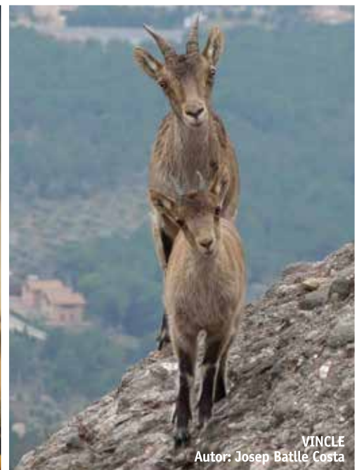
VINCLE Autor: Josep Batlle Costa