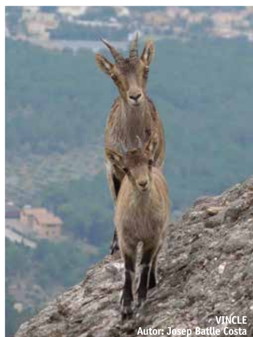
VINCLE Autor: Josep Batlle Costa