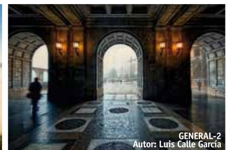
GENERAL-2 Autor: Luis Calle García