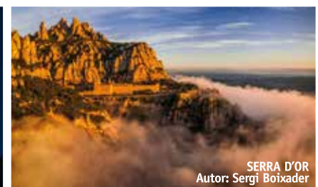
SERRA D'OR Autor: Sergi Boixader