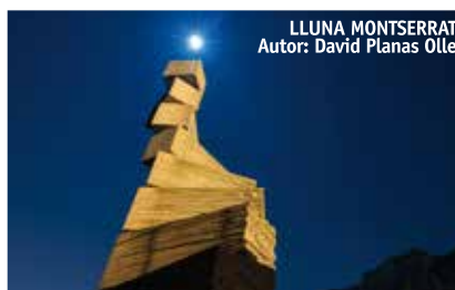
LLUNA MONTSERRAT Autor: David Planas Olle