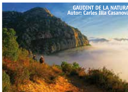
GAUDINT DE LA NATURA Autor: Carles Illa Casanova