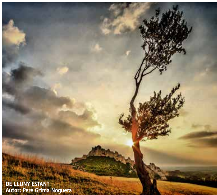
DE LLUNY ESTANT Autor: Pere Grima Noguera