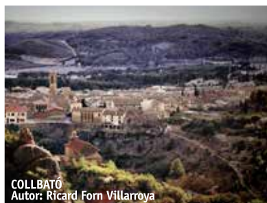
COLLBATÓ Autor: Ricard Forn Villarroya