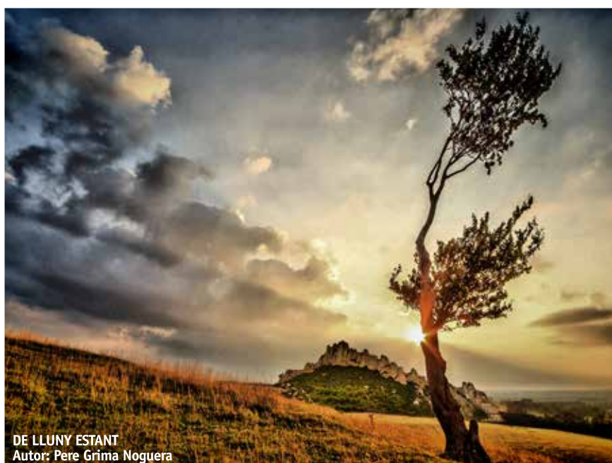
DE LLUNY ESTANT Autor: Pere Grima Noguera