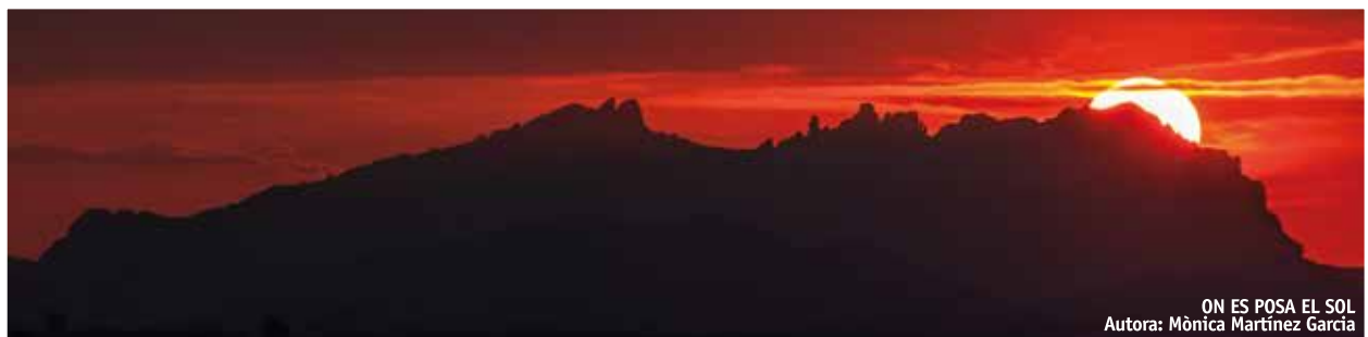
ON ES POSA EL SOL Autora: Mònica Martínez García