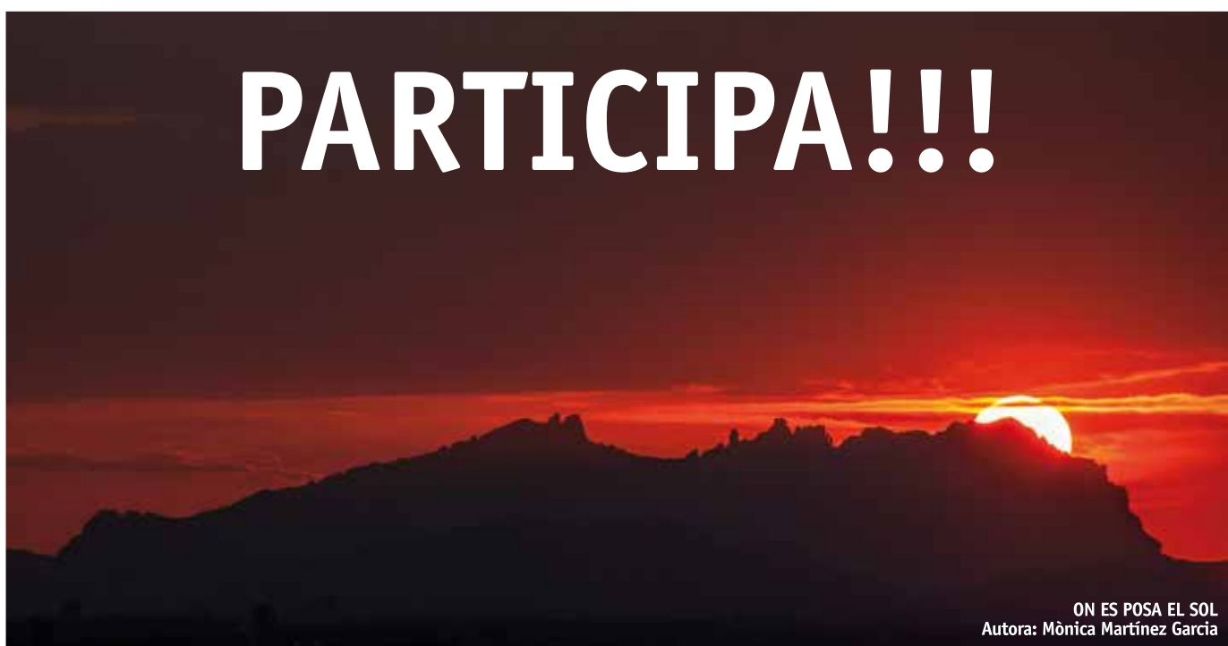
ON ES POSA EL SOL Autora: Mònica Martínez Garcia